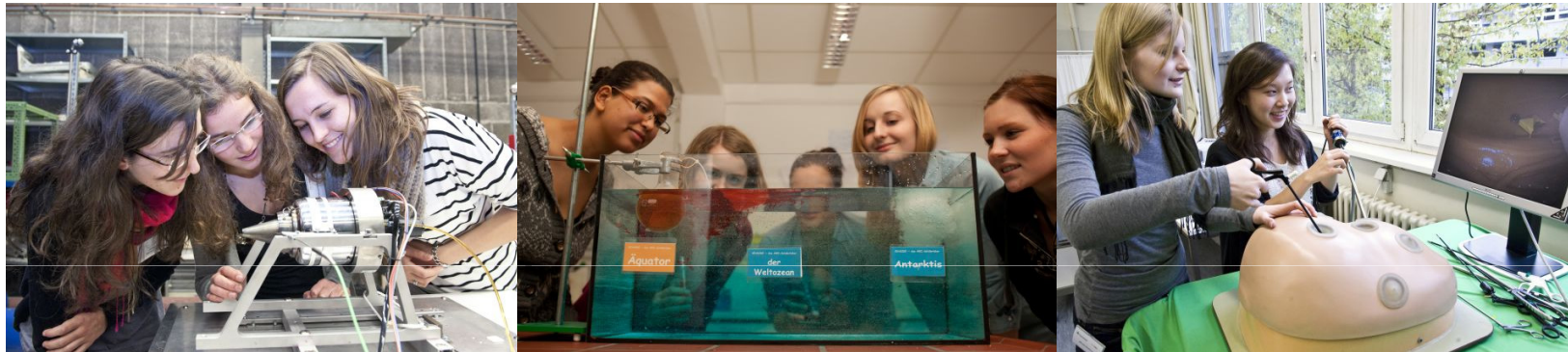
Ort: Alfred-Wegener-Institut Bremerhaven

Ein Projekt von Femtec.GmbH und LIFE e.V.